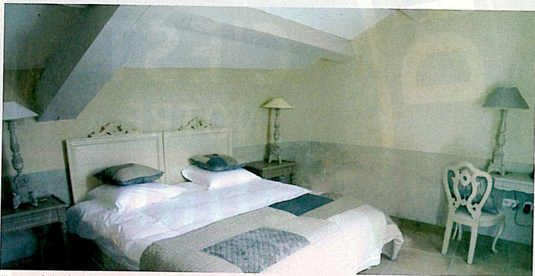
Un an après le début des travaux, le bâtiment en ruine a retrouvé son caractère.

Garrigae, la société créée par Miguel Espada, a d'abord prospéré dans la finance et la construction de maisons traditionnelles avant de se lancer dans l'aventure hôtelière, avec un premier établissement dans l'Hérault : Le Couvent d'Hérépian. Cette résidence de tourisme haut de gamme a été aménagée au centre du village d'Hérépian, dans un ancien couvent du XVII e siècle. La rénovation a été réalisée selon les règles de ce que Miguel Espada appelle les 'valeurs' de Garrigae : authenticité, art de vivre, patrimoine. L'investisseur a fait appel aux artisans locaux afin de donner un aspect rustique et patiné : une partie des anciennes poutres et des pierres ont été réutilisées pour redonner au bâtiment son caractère historique, dans un univers de gris et de blanc, à la fois sobre et chaleureux. L'ambiance et le cadre sont ceux d'une maison d'hôte, mais le spa offre une touche luxe avec piscine, douche et salle de massages, où est proposée toute une panoplie de soins pour le corps. Un bar a été également aménagé au rez-de-chaussée, dont la salle aux tons violets, ainsi que le comptoir de pierres et de métal, doivent accueillir prochainement des amateurs de vins et de tapas.